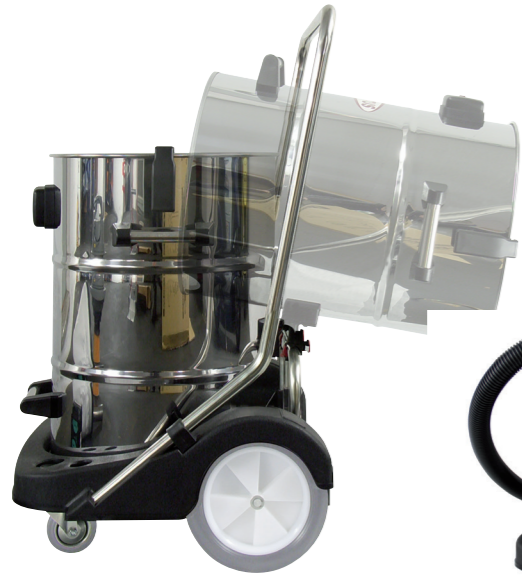
La fonction de basculement permet un vidage ergonomique.