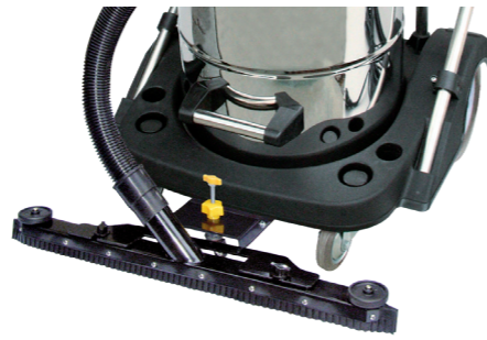
Robuste châssis avec rangement pour accessoires.

N 55/2 E N° article 102010 N 77/3 E N° article 103010