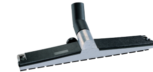
Embout de sol extrêmement robuste en métal, 450 mm. N° article 102051