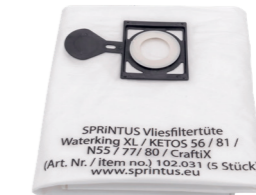
Sac-filtre en feutre. N° article 102031