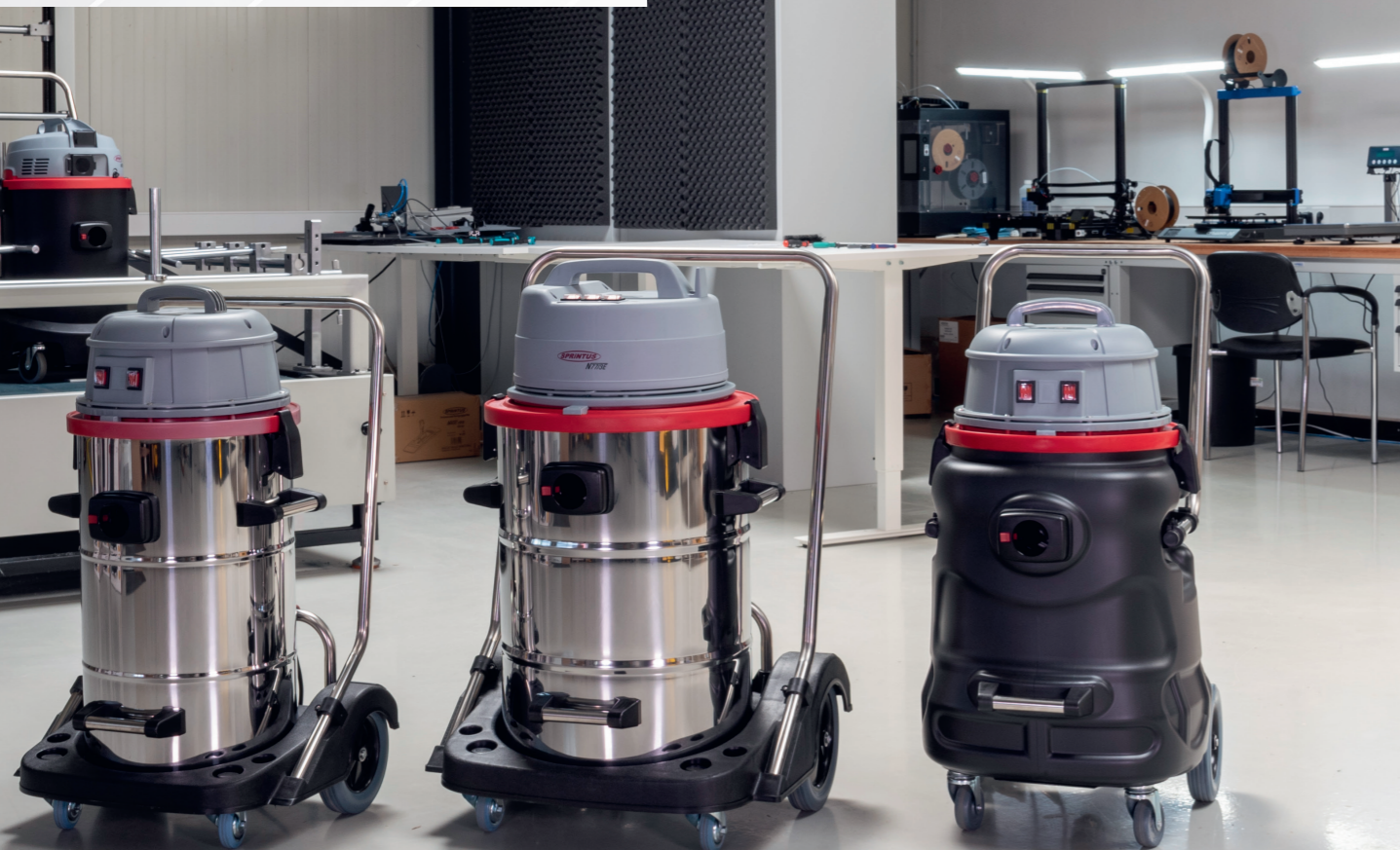
N 55/2 E