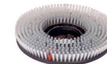
Schamponierbürste. Art.-Nr. 205120