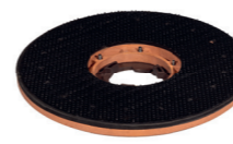
Pad-Treibteller. Art.-Nr. 205122