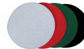
Scheibenpads für jeden Untergrund in verschiedenen Härtegraden.