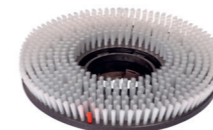
Schrubbbürste. Art.-Nr. 205121

Schalter für den Wechsel zwischen den Arbeitsgeschwindigkeiten. L = 180 U/min. H = 360 U/min.