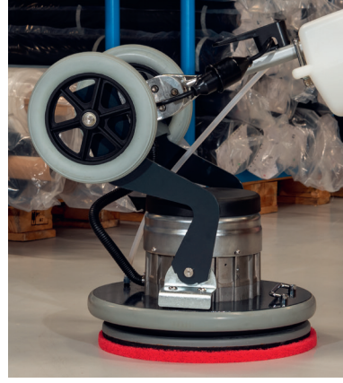
Kippbare Deichsel zur Erhöhung des Anpressdruckes.