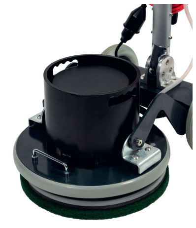
Optionales Zusatzgewicht, 12 kg. Art.-Nr. 207119