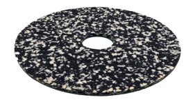
Power Pad für alle Oberflächen. Art.-Nr. 201076