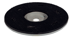
Pad-Treibteller. Art.-Nr. 207113