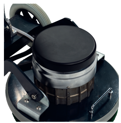
Motorschutzabdeckung schützt den Motor vor Feuchtigkeit.