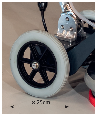
Hervorragende Treppengängigkeit und Stabilität.