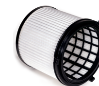
HEPA 13 Feinstaub-Filterpatrone zum Trockensaugen.