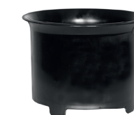
Zykloneinsatz zum Nasssaugen.

Durch den Drall am Einlassstutzen wird der Sprühnebel an der Behälterwand abgeschieden. Zusätzliche Filterstoffe sind nicht mehr notwendig. Die zuverlässige Schwimmerabschaltung reagiert selbst bei extremer Schaumbildung. Seitliche Kühl-Luftschlitze sorgen für konsequente Trennung von Kühl- und Prozessluft.