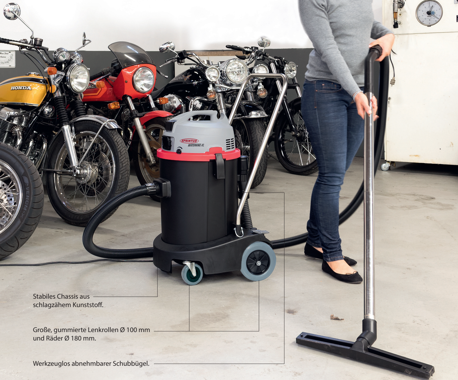
Stabiles Chassis aus schlagzähem Kunststoff.