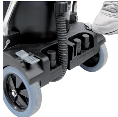
Die Feststellbremse kann beidseitig betätigt werden und verhindert ein ungewolltes Wegrollen des Saugers.