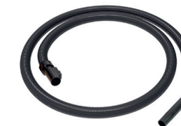
Saugschlauch, 3 m antistatisch. Waterking Art.-Nr. 109112 Waterking XL Art.-Nr. 102116