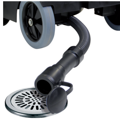
Schmutzwasser-Ablassschlauch zur restlosen Entleerung des Behälters.