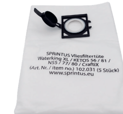
Vliesfiltertüte. Art.-Nr. 102031