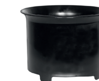
Zykloneinsatz zum Nasssaugen.

Durch den Drall am Einlassstutzen wird der Sprühnebel an der Behälterwand abgeschleudert. Zusätzliche Filterstoffe sind nicht mehr notwendig. Die zuverlässige Schwimmerabschaltung reagiert selbst bei extremer Schaumbildung. Seitliche Kühl-Luftschlitze sorgen für konsequente Trennung von Kühl- und Prozessluft.