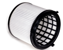
HEPA 13 Feinstaub-Filterpatrone zum Trockensaugen.