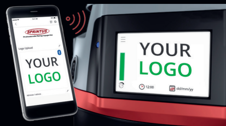
Individualisierung über SPiNTUS APP in Sekunden.