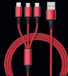
3in1 Ladekabel. Art.-Nr. 117123