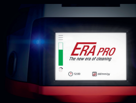
Interaktives Touchdisplay mit aktuellem Datum und Uhrzeit.