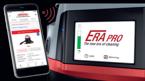
Ausgabe von Störungen und Wartungshinweisen.