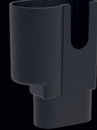
Aufbewahrungsbox. Art.-Nr. 117116