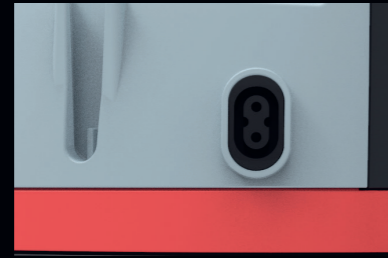
Steckdose für optionale Elektro-saugbürste. Art.-Nr. 111135