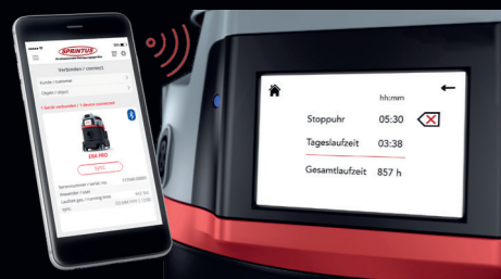
Auslesen/Synchronisieren von Gerätedaten über Bluetooth-Schnittstelle.