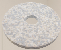
Duo Pad. Art.-Nr. 201077