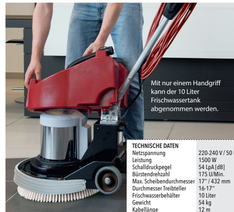
Mit nur einem Handgriff kann der 10 Liter Frischwassertank abgenommen werden.