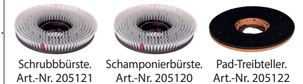
Schrubbbürste. Art.-Nr. 205121 Schamponierbürste. Art.-Nr. 205120 Pad-Treibteller. Art.-Nr. 205122