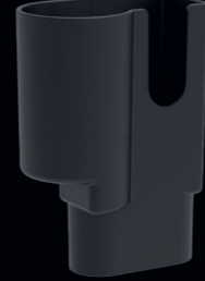
Aufbewahrungsbox. Art.-Nr. 117116