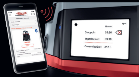
Auslesen/Synchronisieren von Gerätedaten über Bluetooth-Schnittstelle.