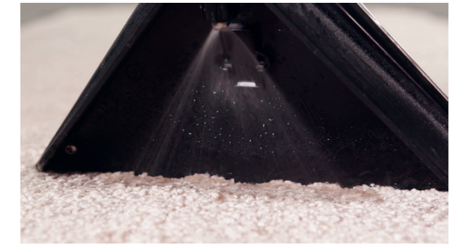
Le produit de nettoyage est pulvérisé selon les besoins.