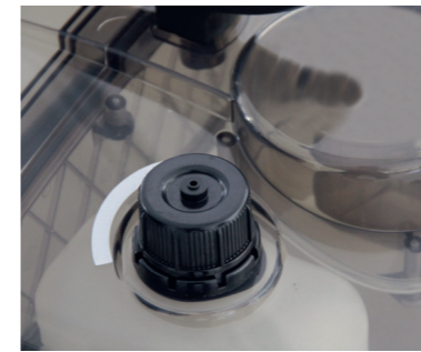
Un réservoir séparé permet l'utilisation d'un produit anti-moussant et garantit ainsi un travail aisé.