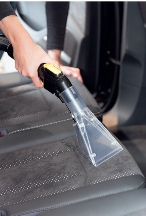
Embout à coussin pour le nettoyage de sièges auto par ex. La fonction de vaporisation est réglable à l'aide de la poignée de commande.