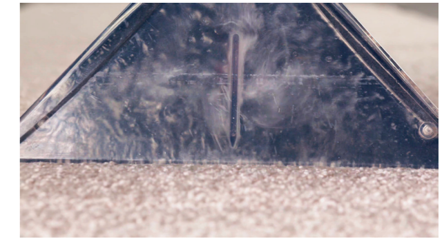
Ensuite, la saleté est aspirée, y inclu le liquide.