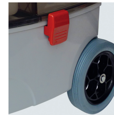
Les grandes roues non marquantes en caoutchouc pour les travaux de voie libre.