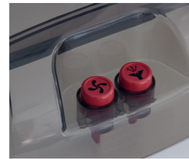
Boutons de sélection distincts sur l'appareil pour choisir entre fonction d'aspiration et de pulvérisation.