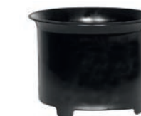
Zykloneinsatz zum Nasssaugen.

Durch den Drall am Einlassstutzen wird der Sprühnebel an der Behälterwand abgeschleudert. Zusätzliche Filterstoffe sind nicht mehr notwendig. Die zuverlässige Schwimmerabschaltung reagiert selbst bei extremer Schaumbildung. Seitliche Kühl-Luftschlitze sorgen für konsequente Trennung von Kühl- und Prozessluft.