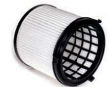
HEPA 13 Feinstaub-Filterpatrone zum Trockensaugen.