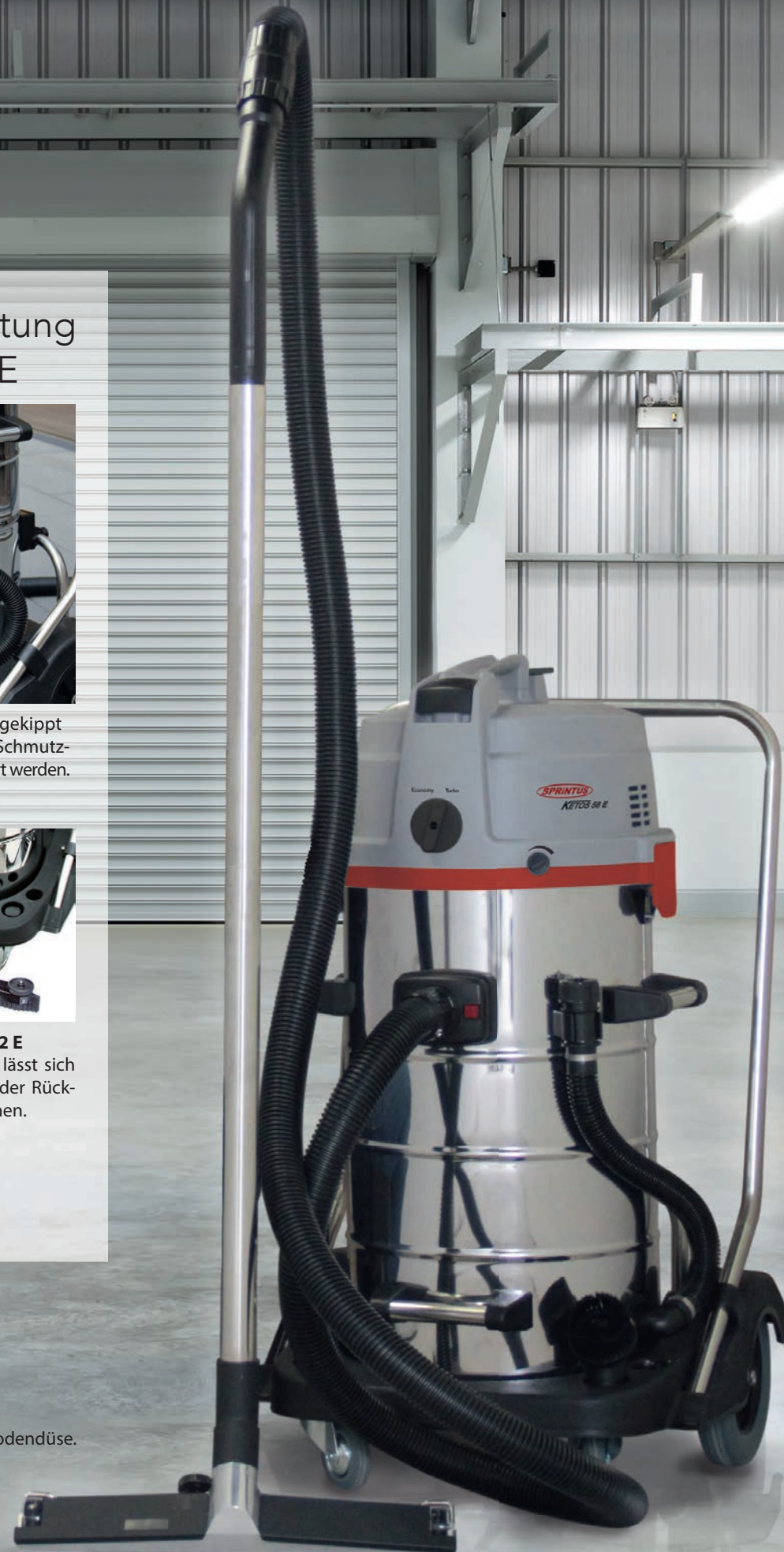
Abb. mit optionaler Metallbodendüse. Art.-Nr. 102051

Optional für den Ketos 56/2 E Die 650 mm Fahrbahndüse lässt sich bequem per Fußpedal von der Rückseite des Saugers aus bedienen. Art.-Nr. 102010