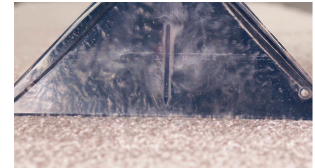
Anschließendes Aufsaugen des Schmutzes, inkl. Flüssigkeit.

Glasklare Polster-Sprühdüse zur Reinigung von Polstermöbeln oder Fahrzeugsitzen. Ergonomischer Handgriff mit handlichen, bequemen Bedienelementen. Die Sprühfunktion ist per Bedienelement am Handgriff dosierbar.