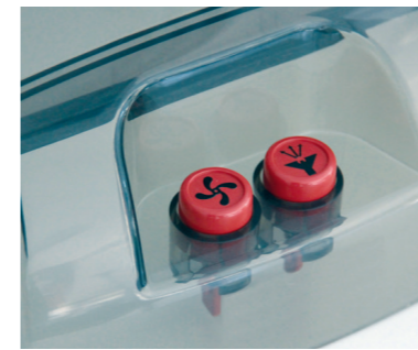
Sprüh- und Saugfunktion sind einzeln am Gerät zuschaltbar.