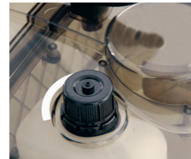
Ein separater Tank ermöglicht den Betrieb mit Entschäumer und garantiert damit ein kontinuierliches Arbeiten.