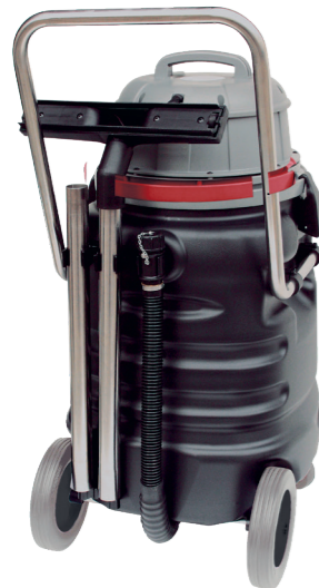
Steckplätze zum griffbereiten Aufbewahren des Zubehörs an der Geräterückseite.