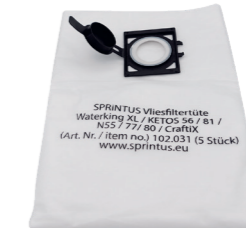
Vliesfiltertüte. Art.-Nr. 102031