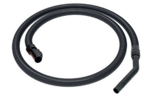
Saugschlauch, 3 m antistatisch. Art.-Nr. 102116