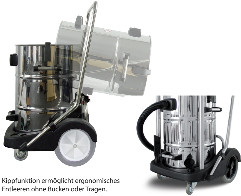
Kippfunktion ermöglicht ergonomisches Entleeren ohne Bücken oder Tragen.