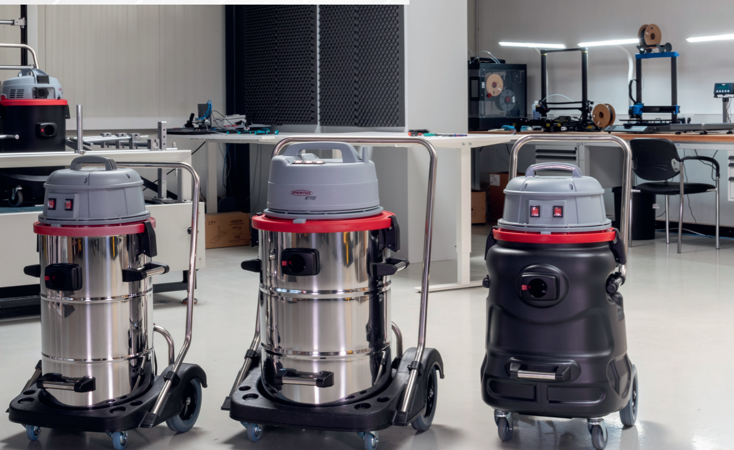
N 55/2 E