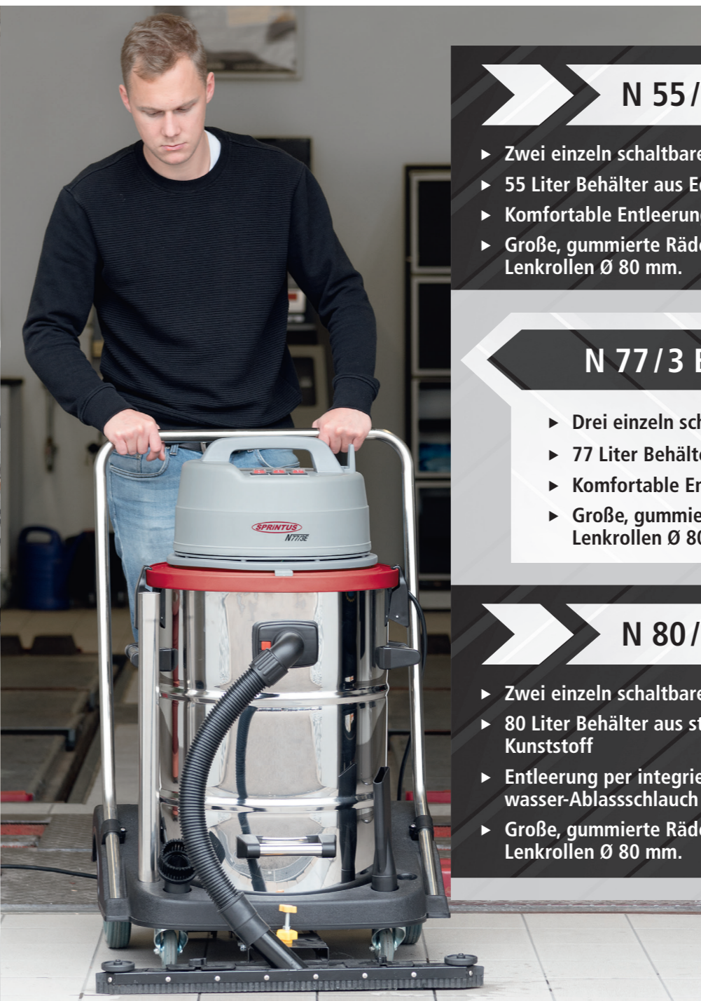
N 80/2 K