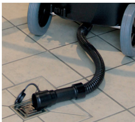
Schmutzwasser-Ablassschlauch zum bequemen, restlosen Entleeren des Behälters.