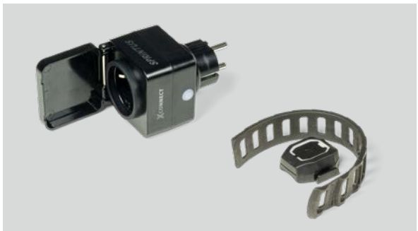
Xconnect Set : Steckdose, Transmitter & Gummiband