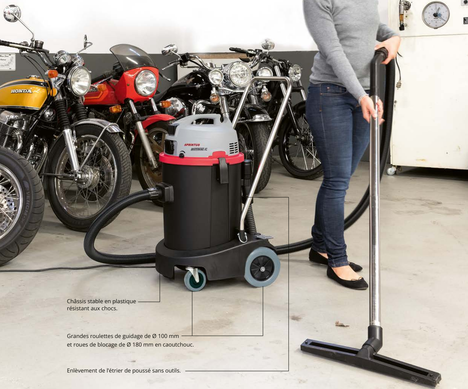
Châssis stable en plastique résistant aux chocs.