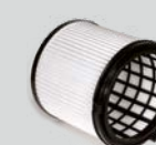
HEPA 13 Feinstaub-Filterpatrone zum Trockensaugen.