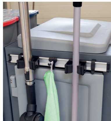
Deux porte-outils supplémentaires peuvent être installés ultérieurement.