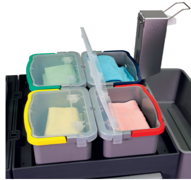
Codage en 4 couleurs continu. Support optimal grâce à des seaux abaissés.