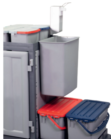
Seau suspendu de 30 litres. N° article 305035