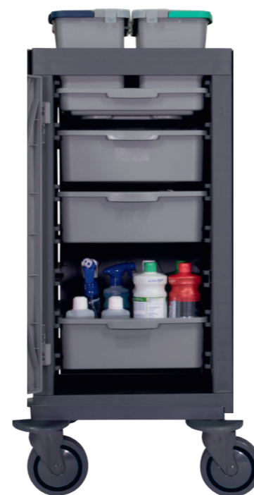
Tiroirs Équipement standard (sans accessoires).

Volume de chargement élevé et bacs d'une grande facilité de mouvement.