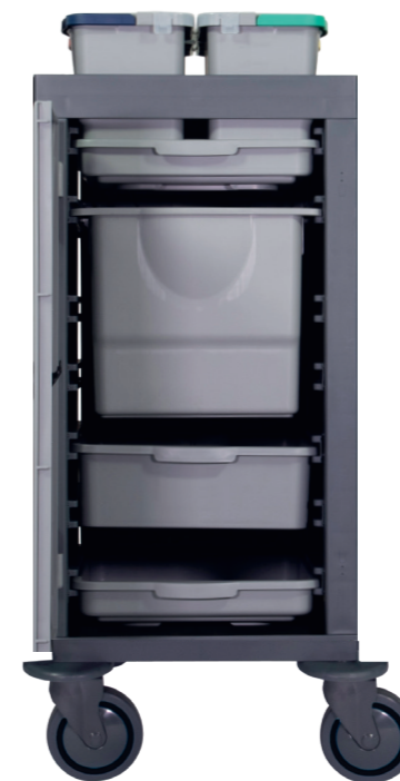
Bacs profonds 18 L., en option. N° article 305034