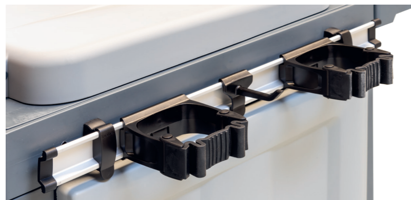
Porte-outils multifonctionnel en série. N° article 305043