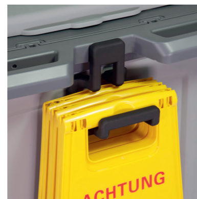
Support pratique pour un maximum de trois panneaux d'avertissement.