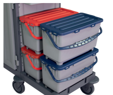
Transport d'un maximum de quatre boîtes de balais à franges.