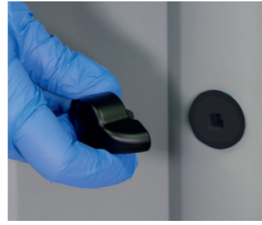
Protection contre l'accès non autorisé par des clés amovibles.