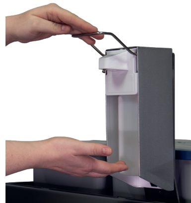
Distributeur de désinfectant pour 500 ml. N° article 301289