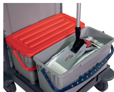
Montage sans contact avec balai rasant V-Wing en option (p. 114).