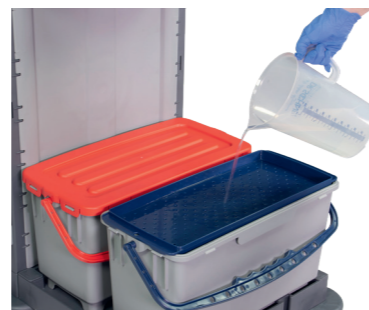
Assistance pour le trempage en option. N° article 305032 bleu & 305033 rouge