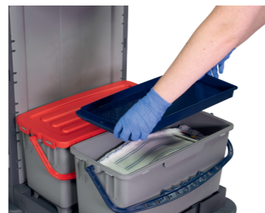
Capacité de 10 serpillières en 40 cm par boîte.