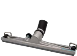
Buse professionnelle pour sols métalliques 450 mm pour les utilisations les plus difficiles.N° article 113250