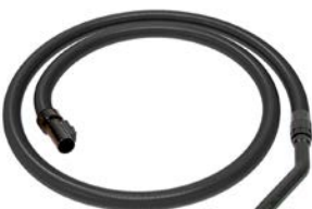
Tuyau d'aspiration complet 2,5 m, antistatique, résist.huile. N° article 118193