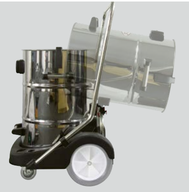
La fonction de basculement permet une vidange ou une purge.