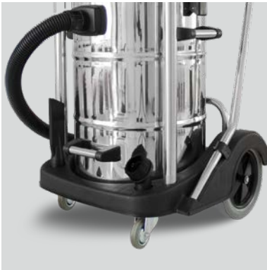
Châssis robuste avec rangement pour accessoires.