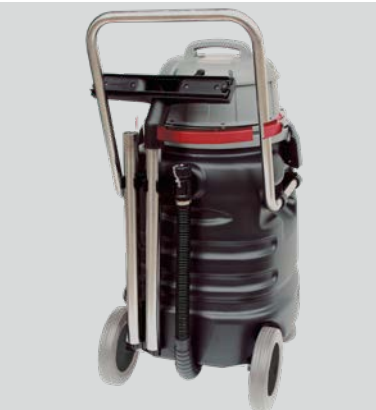
Fentes pour accessoires au dos de l'appareil .