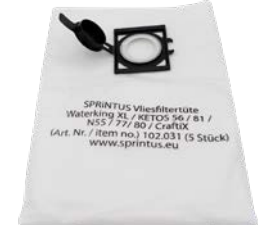
Sac-microfibre en non-tissé de 35 ou 50 litres N° article 102031 35 L N° article 102072 50 L