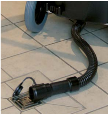
Tuyau de vidange des eaux sales pour un vidage confortable du réservoir.