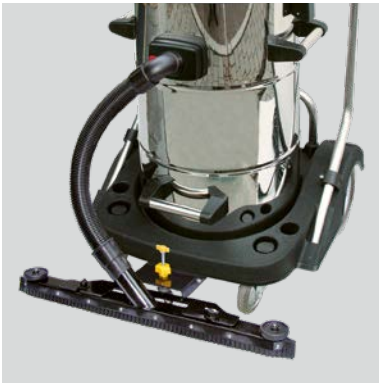
En option: L'embout coulissant de 650 mm est facile à manier grâce à la pédale située à l'arrière de l'aspirateur. N 55/2 E N° article 102010 N 77/3 E N° article 103010