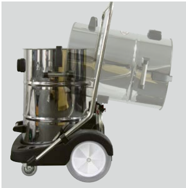
Kippfunktion ermöglicht ergonomisches Entleeren ohne Bücken oder Tragen.