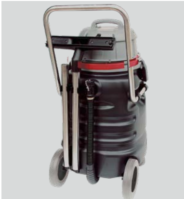
Steckplätze zum griffbereiten Aufbewahren des Zubehörs an der Geräterückseite.