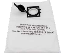
Vliesfiltertüte mit 35 oder 50 Litern Art.-Nr. 102031 35 L Art.-Nr. 102072 50 L