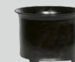
Insert cyclone pour l'aspiration de l'eau.

Grâce à la rotation au niveau de l'entrée, le brouillard de fines gouttelettes est séparé contre la paroi du réservoir. L'usage d'autres filtres n'est plus nécessaire. L'interruption automatique par flotteur réagit également en cas de formation massive de mousse. Les fentes latérales pour l'air de refroidissement garantissent une séparation stricte de l'air de refroidissement et de l'air d'exploitation.