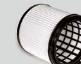
Cartouche de filtrage HEPA 13 pour l'aspiration de poussière.