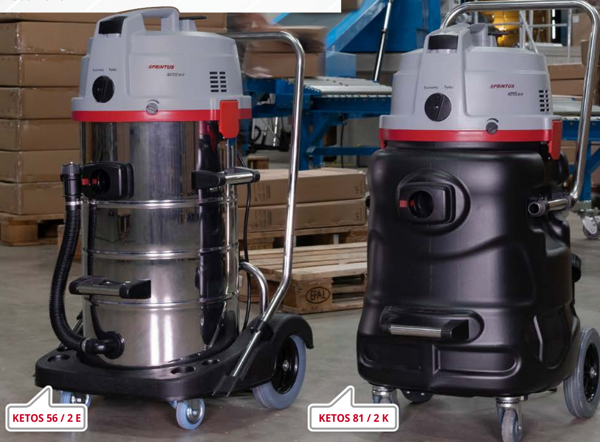
KETOS 56 / 2 E