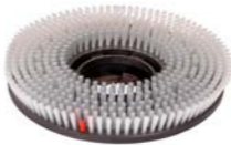
Brosse douce. N° article 205120