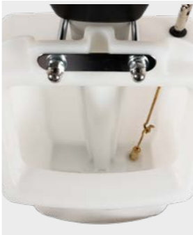
Mécanisme entièrement en métal. Les composants en contact avec l'eau sont usinés en laiton.