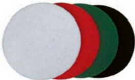
Pads pour tous types de sols disponibles avec différents degrés de dureté.