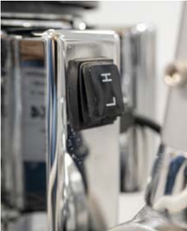
Interrupteur pour changer de vitesse. L = 180 tours/min. H = 360 tours/min.