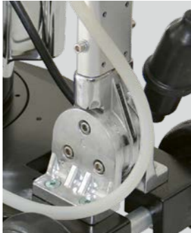
Un timon robuste et de qualité supérieure à jeu nul pour une manipulation optimale.