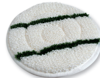
Queen Bonnet-Pad, erzielt auf Teppich und Teppichböden beste Reinigungsergebnisse. Art.-Nr. 201.009