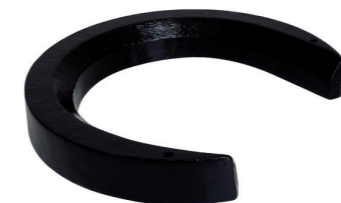
Zusatzgewicht 14 kg. Art.-Nr. 201.068