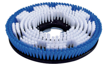
Schamponierbürste Art.-Nr. 201.003