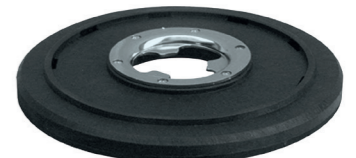
Pad-Treibteller Art.-Nr. 201.004