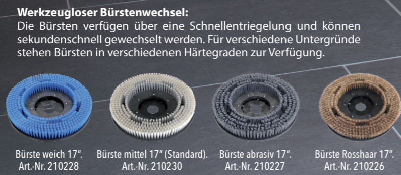
Bürste weich 17" Art.-Nr. 210228 Bürste mittel 17" (Standard) Art.-Nr. 210230 Bürste abrasiv 17" Art.-Nr. 210227 Bürste Rosshaar 17" Art.-Nr. 210226

Optional: Pad-Treibteller und Pads in verschiedenen Härtegraden.