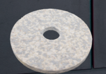
Duo Pad. Art.-Nr. 201077