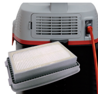
Der MAXIMUS pro ist ausblasseitig mit einer werkzeuglos austauschbaren EPA12 Filterkassette ausgestattet.