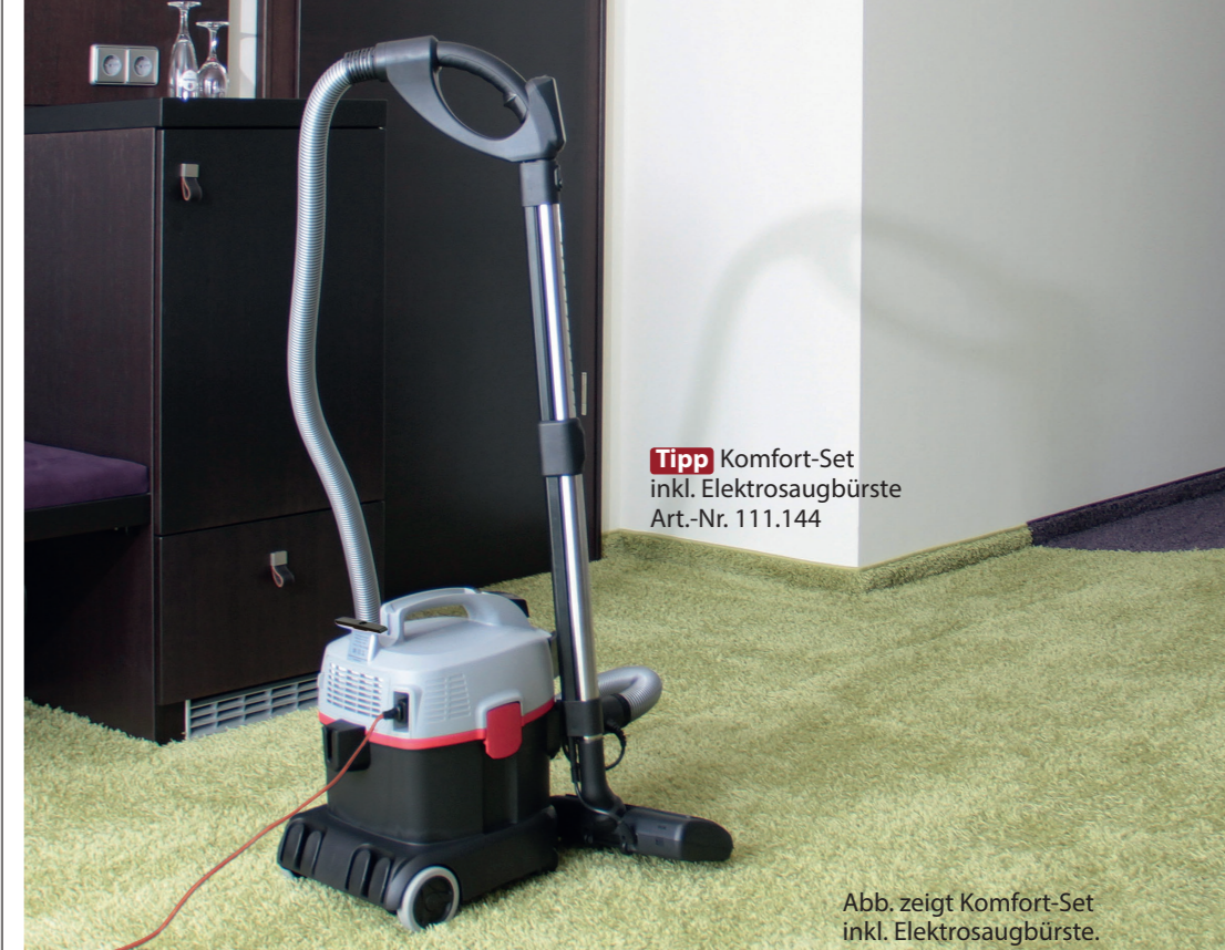
Tipp Komfort-Set inkl. Elektroaugbürste Art.-Nr. 111.144