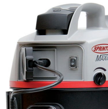
Steckdose mit Automatikfunktion für Zuschaltung der Elektroaugbürste.