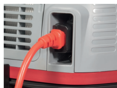
Verbesserte Sicherheit und Komfort: Signalrotes, steckbares 10 m Geräte-kabel.